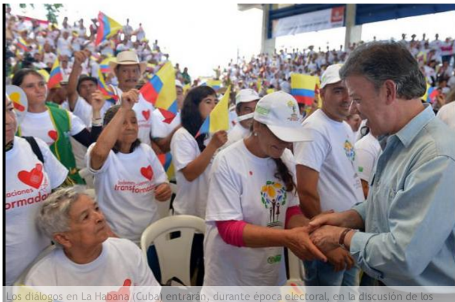
Los diálogos en La Habana (Cuba) entrarán, durante época electoral, en la discusión de los puntos que han sido catalogados por muchos como los fundamentales. // http://www.eluniversal.com.co/sites/default/files/colp_ext_010909_c137b.jpg